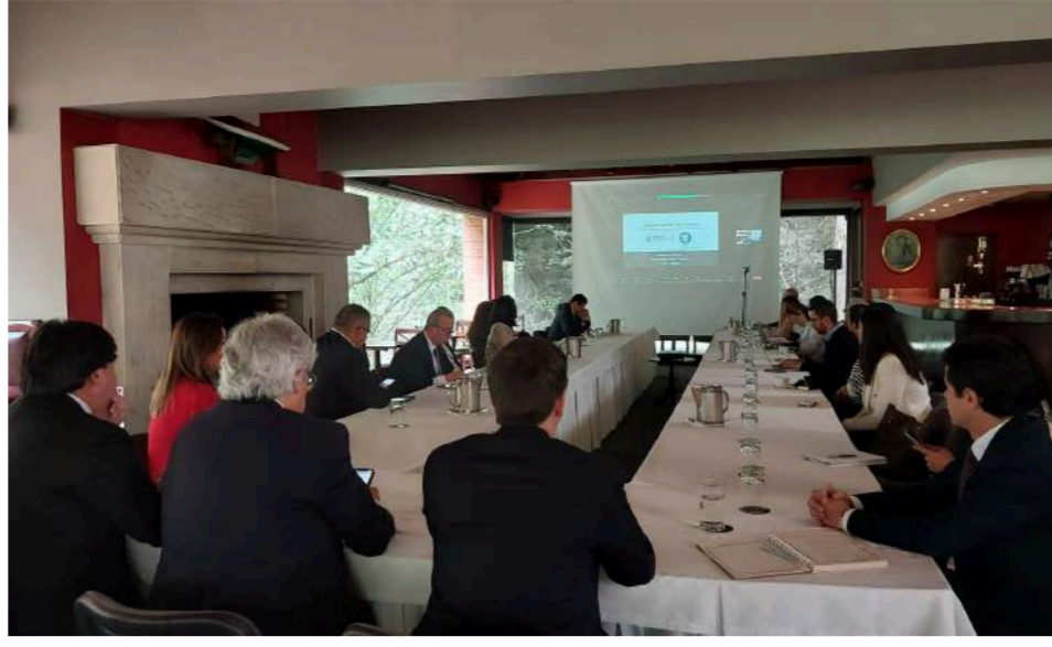
En alianza con Cremades & Calvo-Sotelo se desarrolló el evento “Compliance para negocios seguros binacionales” .