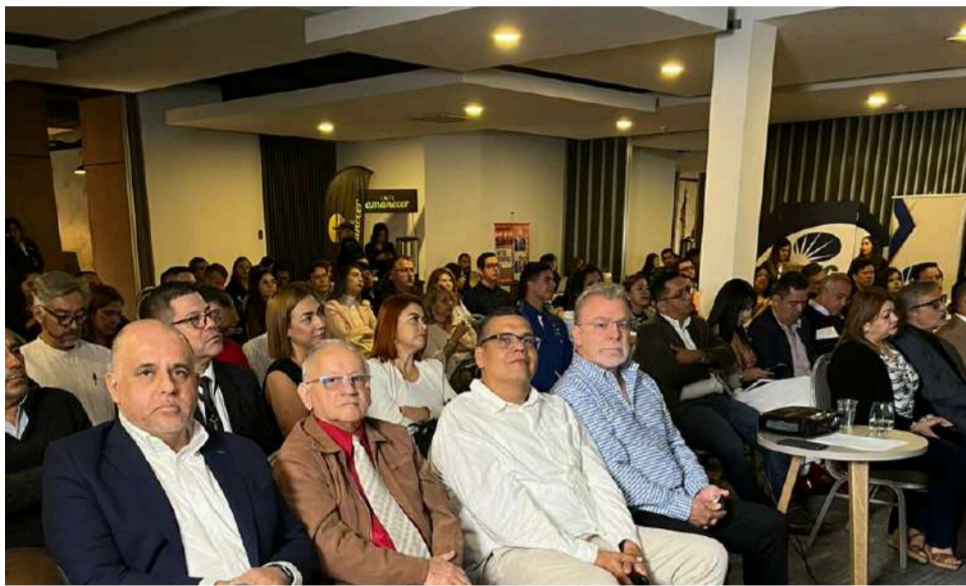
Por invitación de la C.C. del Táchira y sus aliados se organizó en San Cristóbal una conferencia y conversatorio sobre la facilitación del comercio entre Colombia y Venezuela.