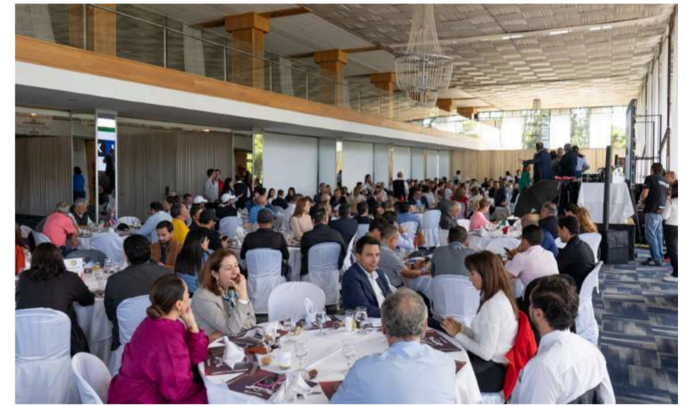
II edición del Torneo Intl. de Golf y Networking de negocios organizado por la Red de Cámaras Binacionales de Colombia.