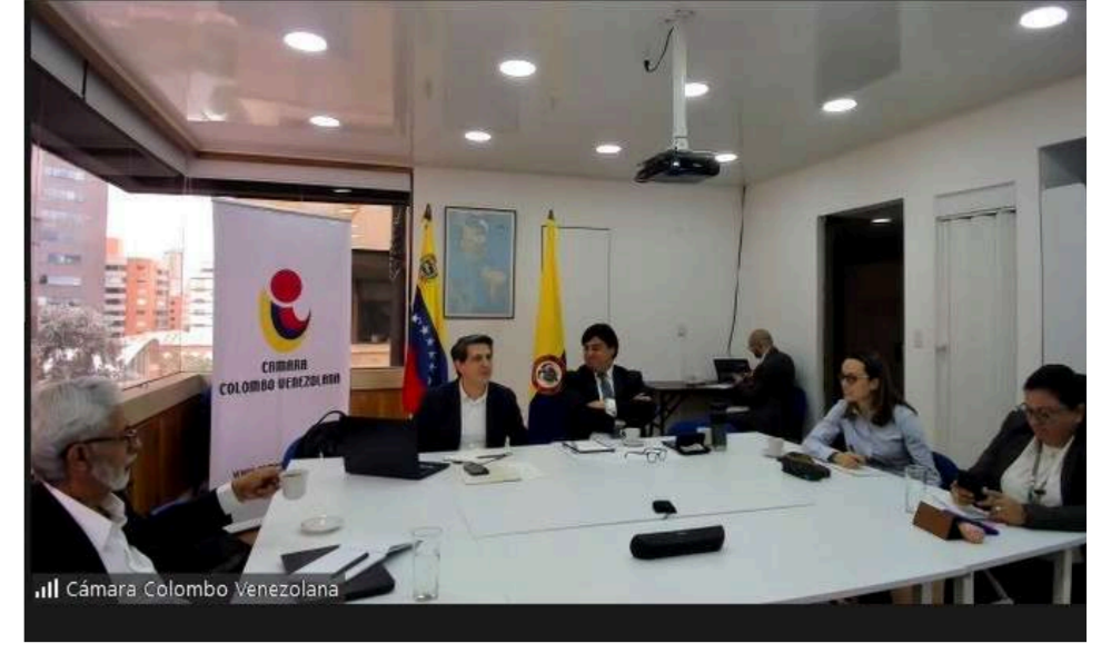
Tuvo lugar la primera sesión del Comité de “Acceso a mercados y facilitación del comercio” de la Cámara Colombo Venezolana.