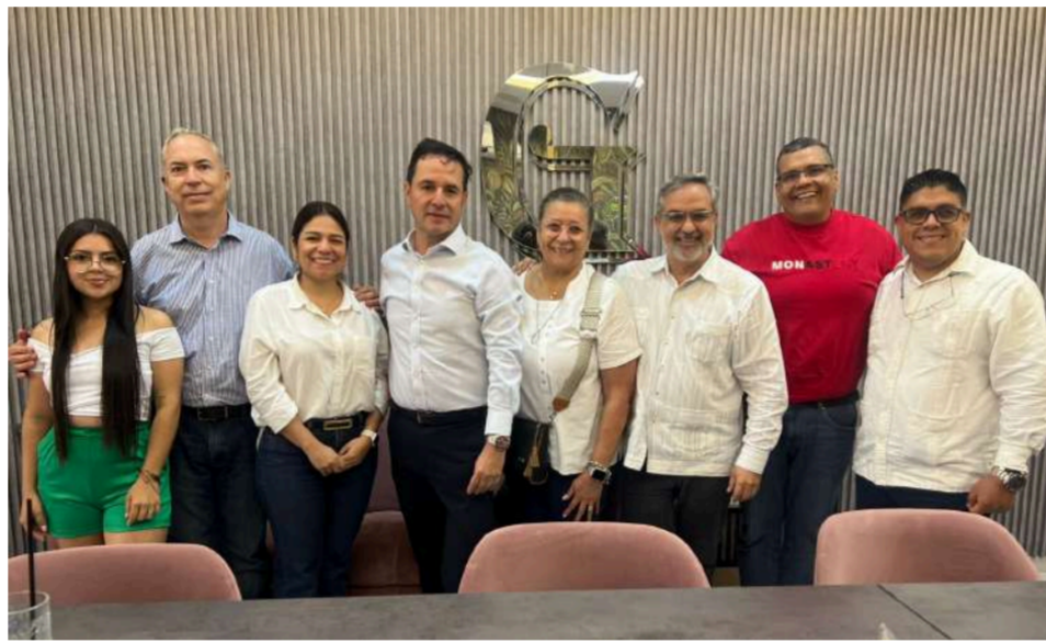
Acompañados por CAVECOL, FITAC, y empresarios colombianos y venezolanos se llevó a cabo un desayuno empresarial en Cúcuta, Norte de Santander.