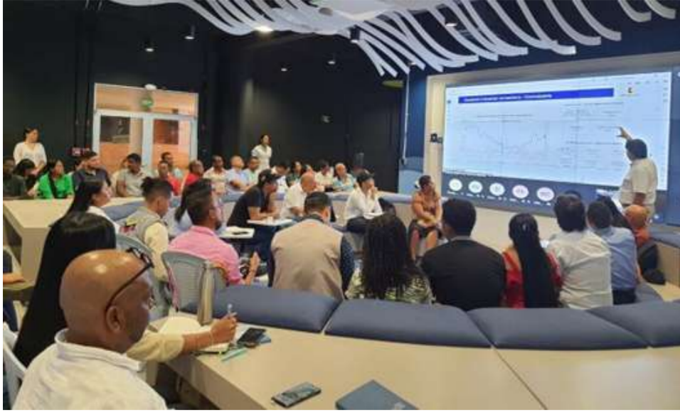
Con la C.C. de La Guajira, se realizó la conferencia “Oportunidades de negocios en la frontera colombo venezolana” .