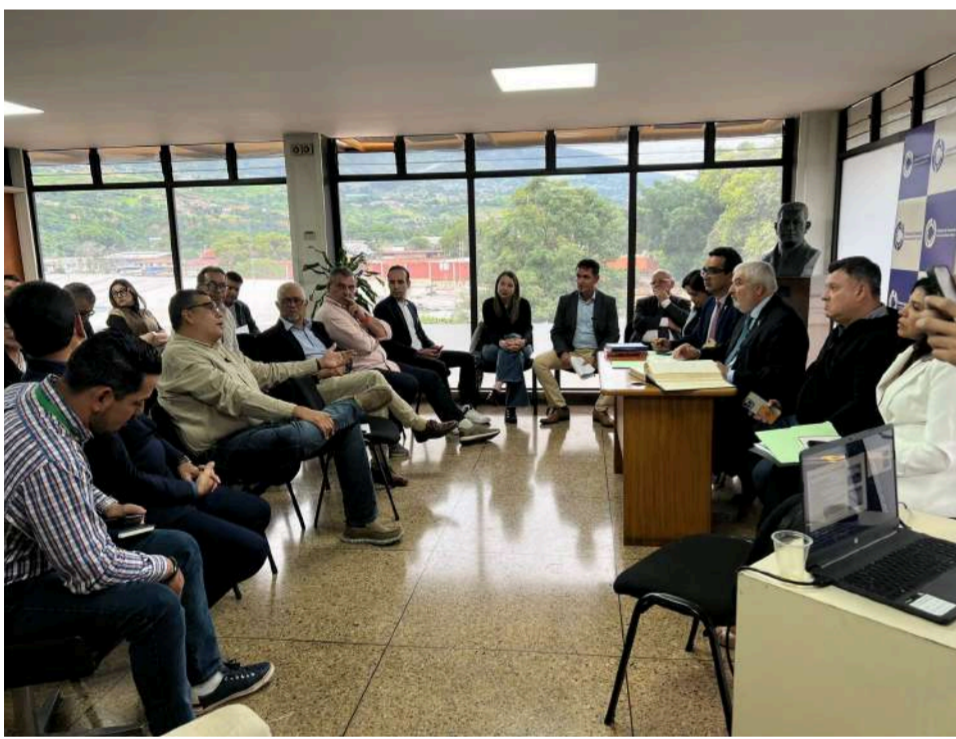
Gracias a CAVECOL y junto al PNUD, se participó en una reunión sobre el mercado binacional fronterizo en San Cristóbal.